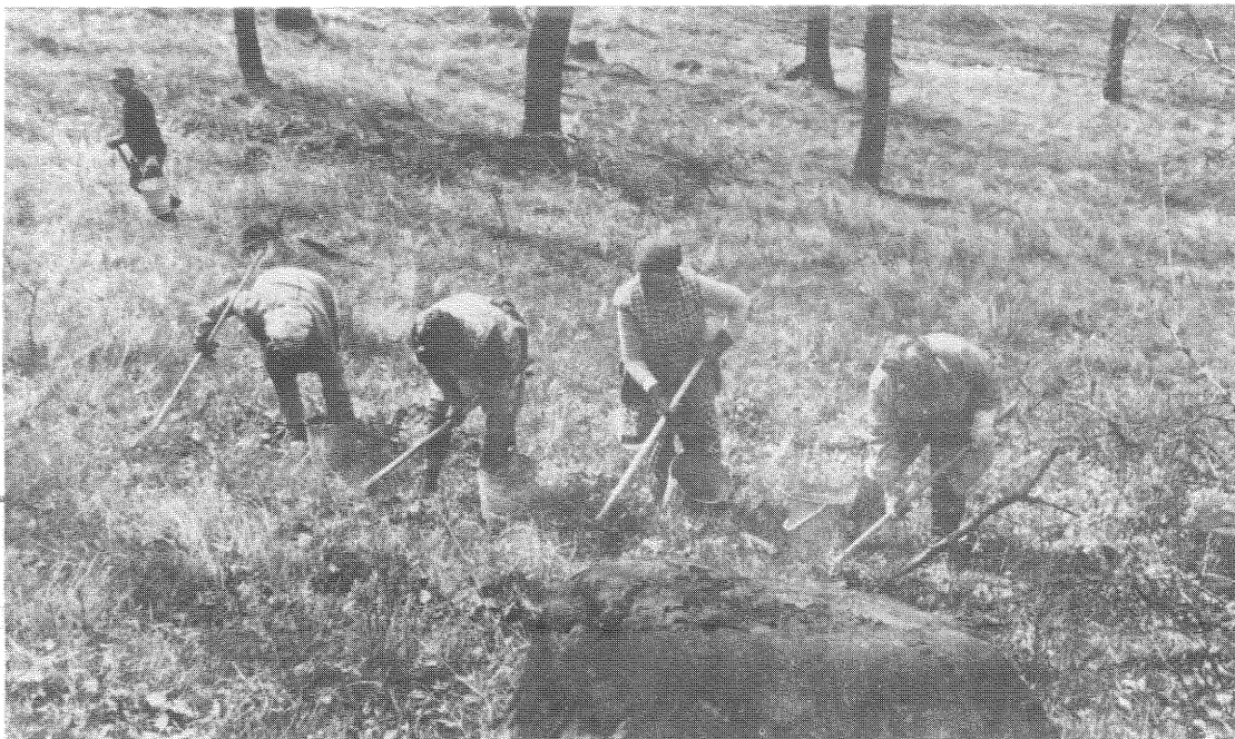
Jól sikerült a tavasi makkvetés

— Az elmúlt évre tervezett erdészeti eredményünket több mint 2 millió forinttal megemeltük, így meghaladta a 8 millió forintot — tért át a gazdálkodás jellemzőinek bemutatá-