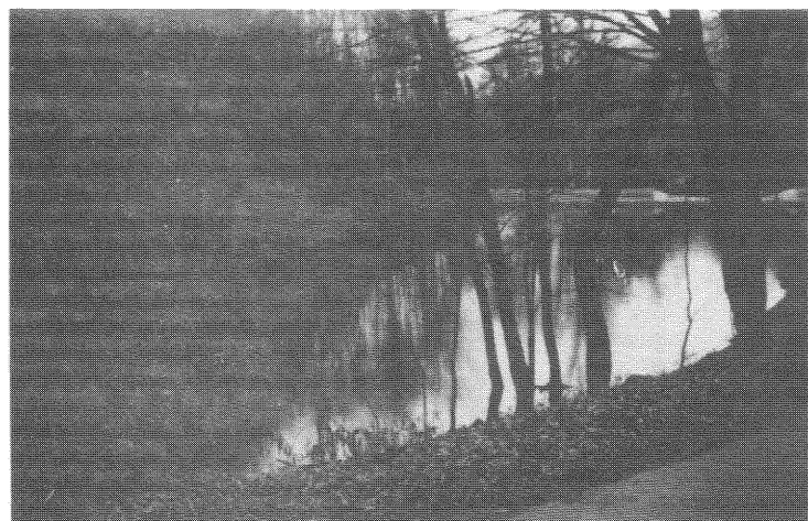
A völgyek vízrendezési programja során valósult meg ez a mesterséges tó

Az 1975. évi Országos Erdészeti Vándorgyűlés után intenzíven elkezdődött a kirándulóközpont kiépítése. Ezt később a Parkerdészeti üzemeltető, de idén — a camping és a vendéglátó egységek kivételével — újra mi gondozzuk.