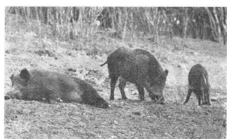
Már 200 darab körül van az állomány.

Igen nagy gond azonban, hogy a kilövés szinte megoldhatatlan a lakott területeken. A szabály az, hogy a lakott területtől legálább 300 méterre kell vadászni. Felmentést, eseti engedélyt a Budapesti Rendőrfőkapitányság adhat: ez pontosan megje-