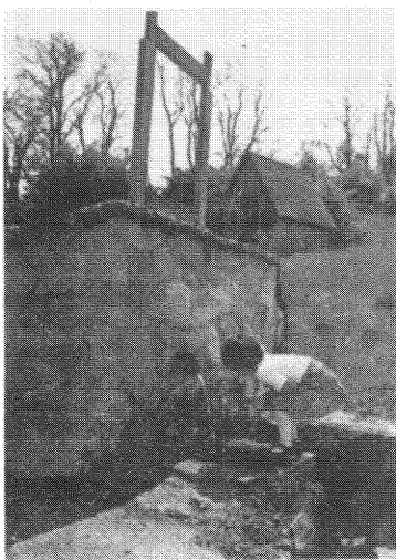
A Főkúti forrás