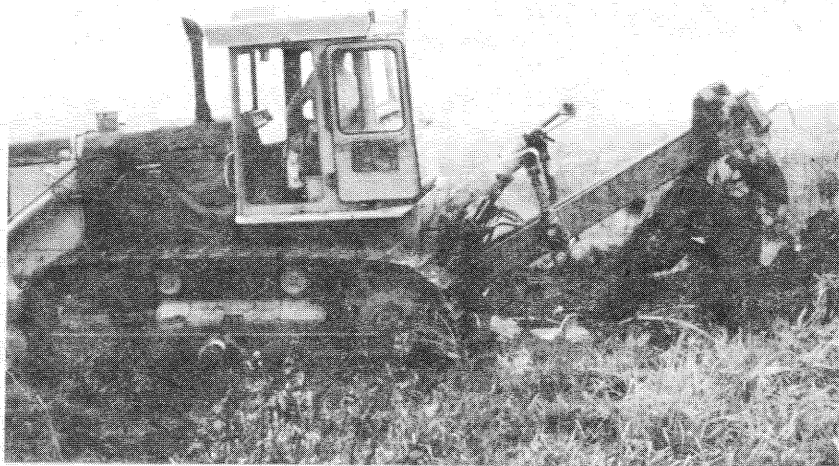
Idén 45 hektáron hajtottak végre tuskózást, mélyforgatást

Mindent elkövetünk a vadászhatunk forgalmának növelése érdekében. Minthogy vadászvendégekre csak az év rövid időszakában számíthatunk, kapcsolatba léptünk több