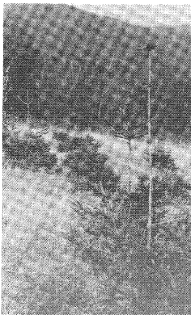
Idén is jelentős gondot okozott a vadkár.

Ebben az évben az átlagos belépő erdőfelújítási kötelezettség mértékét jóval meghaladó területű erdősítésünk vált befejezetté. Erdőfelújításban 537 ha erdőt adtunk át 443 ha sikeres területtel, ezenkívül 30 ha erdőtelepítésünk is befejezést nyert. Befejezett erdeink minősége gyakran elmarad a szakmailag kívánatostól és lehetségestől. Ebben persze közrejátszik az is, hogy az Erdőfelügyelőség - a főhatóság egyetértésével - több erdőrésztöve is hozzájárult az erdősítés 80%-os sike-