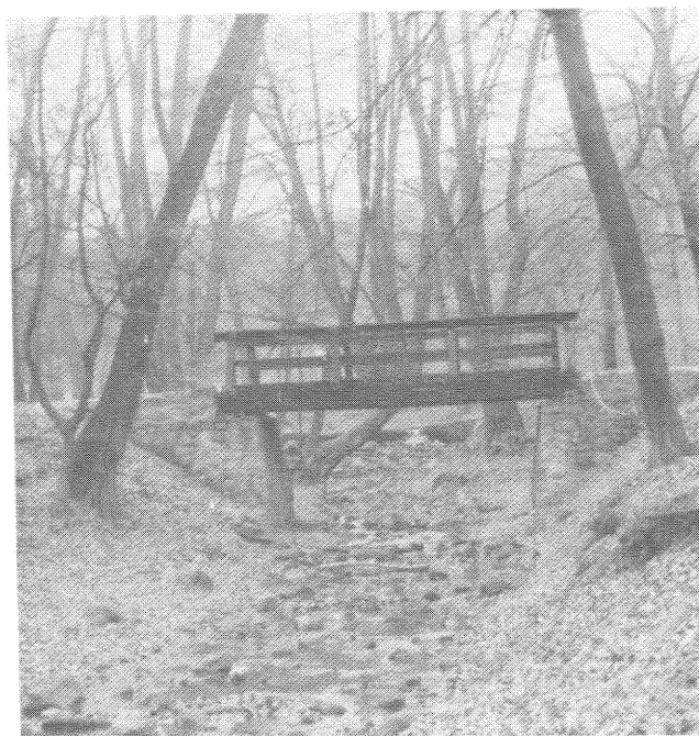
Részlet az Apátkúti patak völgyéből.

- Tavaly, 10 éves üzemtervük kialakításakor az erdőrendezési szolgálat szakemberei ellenében is hangsúlyozták azt a törekvésüket, hogy egyensúlyt tartsanak