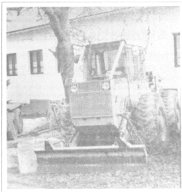
A társerdészetek gyakran másutt javíttatják a gépeiket.

Természetesen nem csak kívülről várunk segítséget. Mi is