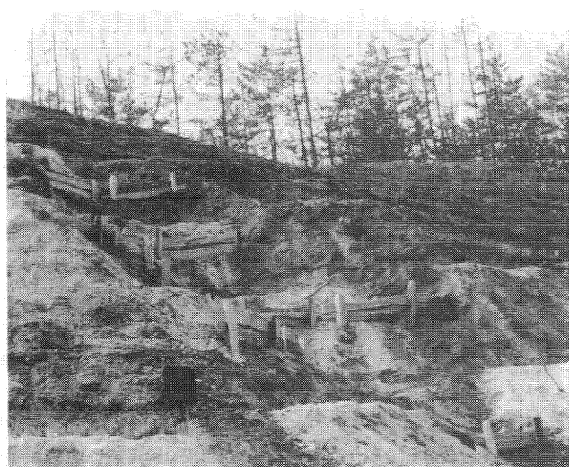
Teraszos padkák, gátak az erózió ellen.

Az első telepítésekre tavasszal kerülhet sor. Szerencsére a legtöbb helyen kevésbé égett át a talaj, mint gondoltuk. Ahol teljesen a kőig elégett minden, ott megmarad a kopár, mert aránytalanul költséges lenne a szakadozott hegyoldalakra talajt fölvenni. De ez csak néhány kisebb foltot fog jelenteni.