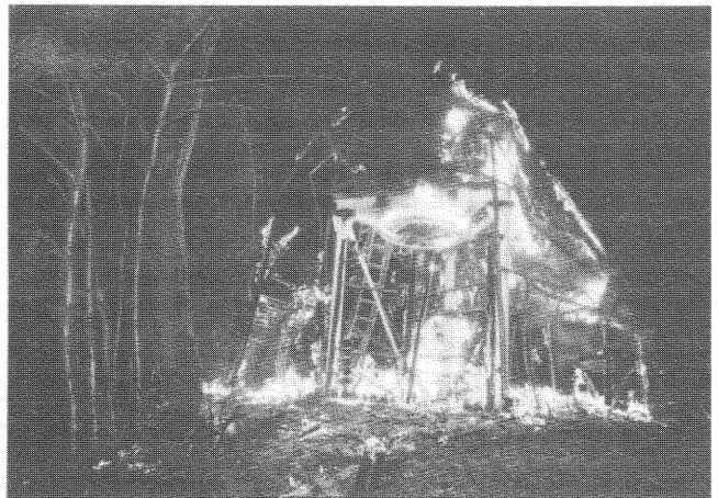
Január 16-án leégett a normafai sífelvonó indítóháza.

Privatizálás: nálunk két földingatlan érint. Azt hiszem, előnyösen túlradhatunk rajtuk, hiszen csak nálam vagy hatvanan érdeklődtek.