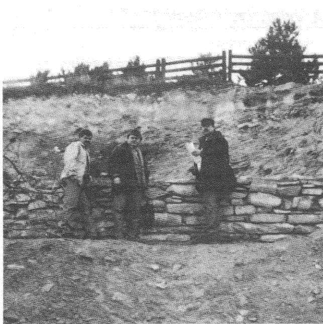
A Martinovics-hegyi rézsú építése.

– Sajnos, igen. Vannak olyan önkormányzatok, amelyek századrangú kérdésként kezelik, hogy milyen állapotban vannak a területükön lévő erdei kirándulóhelyek, sőt – például a szemét eltakarításának ürügyén – hatóságosdit játszanak velünk szemben.