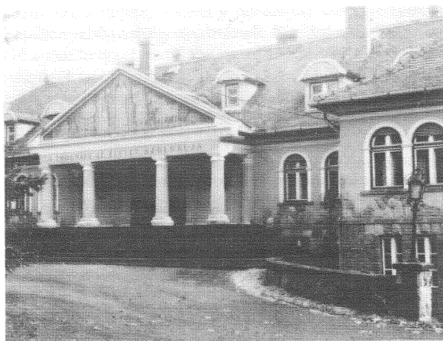
Az erdészet hajdani központi épülete hasznosításra vár.

természetvédelem alá (szinte összes többi területünk a Budai Tájvédelmi Körzethez tartozik). A vadaskertbe tereljük, illetve – élve befogással – szállítjuk át a vadat, s az idén 40 szarvasbikát is vásárolunk. Itt szeretnénk kialakítani olyan összetételű és minőségű vadállományt, amely vendégeink, vevőink igényeit kielégíti. A kert körülzárásánál jórészt a régi kerítéseket használjuk fel, de felújítva. Ismeretes, hogy nálunk igen sok kerítés épült a hetvenes-nyolcvanas években. Ezeket a továbbiakban már nem nagyon bontjuk le, mert a volt tsz- és állami gazdasági földek jórészt magántulajdonba kerültek, nagyon sok ilyen kis parcella érintkezik erdeinkkel, s meg kell védenünk őket a vadkártól. Az új tulajdonosok a korábbiaknál is érzékenyebbek e tekintetben, s némelyek hajlamosak olyan kárt is ránk hárítani, amit nem is a vad okozott.