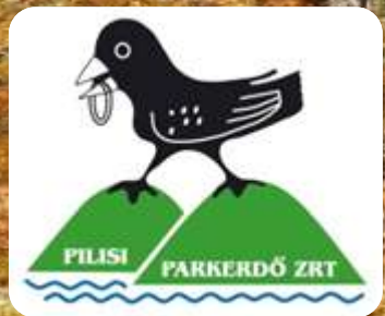
Szálalóerdő a Pilisben